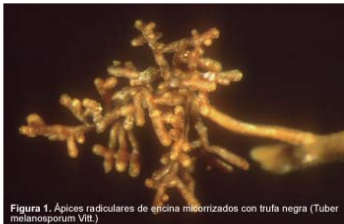
Figura 1. Ápices radiculares de encina micorrizados con trufa negra ( Tuber melanosporum Vitt.)

Las setas y trufas que cultivamos son el fruto de hongos micorrícicos, es decir, hongos que viven en simbiosis con las raíces de las plantas. El órgano simbiótico, conocido como micorriza, se comenzó a estudiar a finales del siglo XIX y juega un papel importante en la nutrición y protección de casi todas las plantas. Las micorrizas presentes en árboles forestales son apenas visibles sin una lupa (Figura 1).