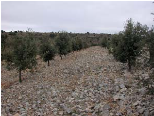
Figura 4. Plantación de encinas truferas en plena producción de 15 años edad y con riego por microaspersión

La edad de la plantación, las condiciones climáticas del año y las características de la plantación interfieren fuertemente en la producción (7) (Figura 4).